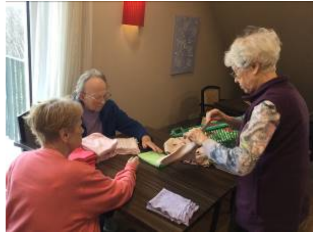
Das bisschen Haushalt...