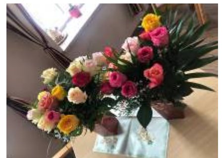
Zum Frauentag wurde, zu Ehren unserer Bewohnerinnen, das Glas erhoben und unsere Seniorinnen wurden mit einem Blumengruß überrascht...