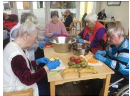
Koch- und Backgruppe, leckerer Salat, herzlich und süß...