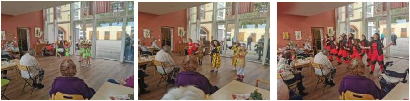
Besuch des Kinderballetts „Keen on Rhythm“...